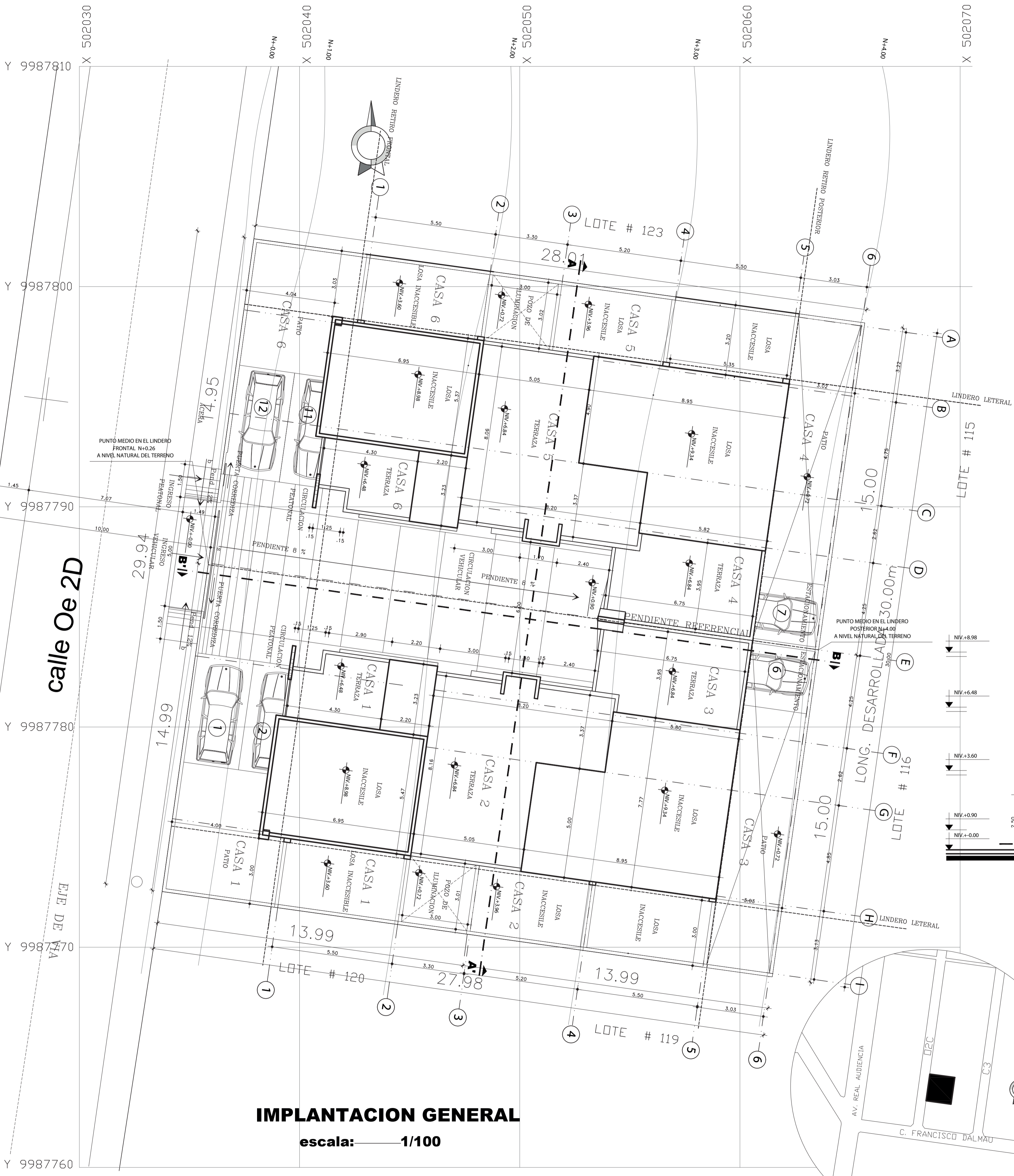
IMPLANTACION GENERAL escala: 1/100